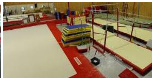
Salle de gymnastique