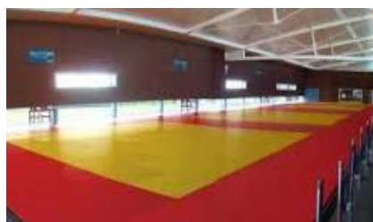
Centre des arts martiaux