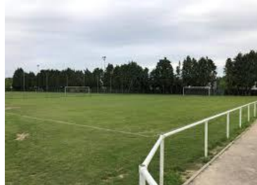
Terrains de football