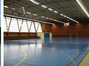
Gymnase Henri Bajot