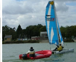
Base nautique Taupont